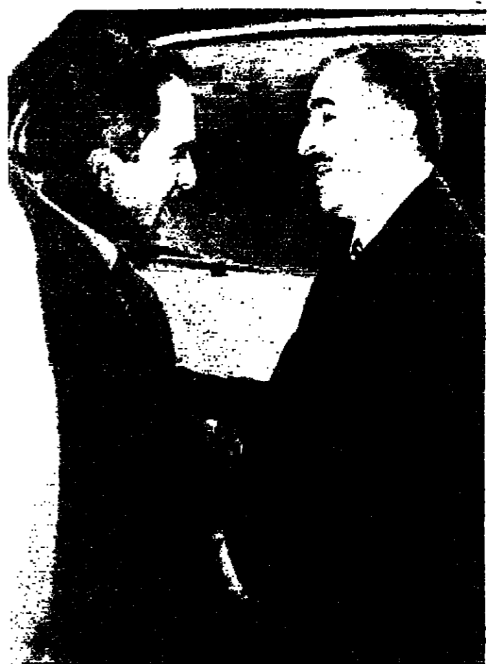
جلالة الملك المعظم يرحب بالسيد رشيد كرامي رئيس وزراء لبنان في مطار عمان